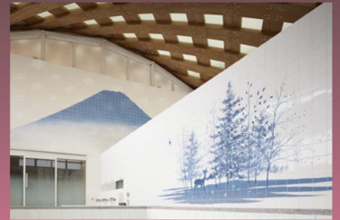
「女川温泉ゆぼっぼ」壁画の原画 8点も展示